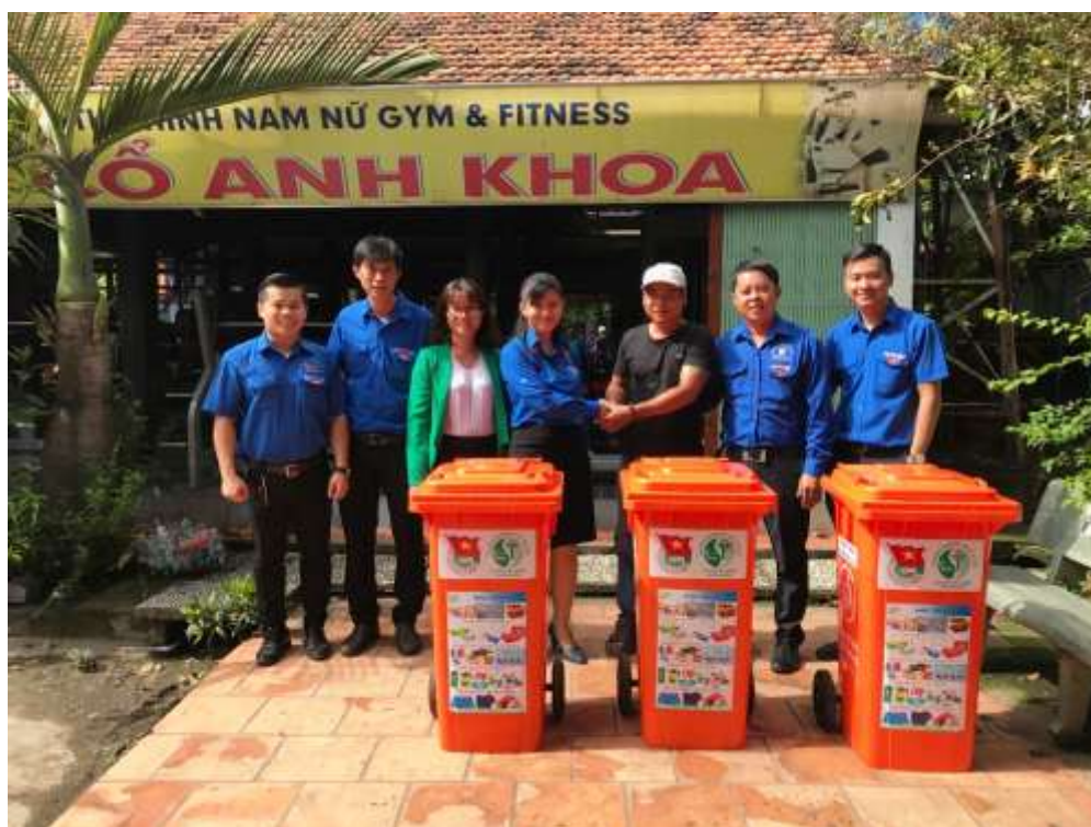
Đ/c Trần Thị Diễm Trinh – Phó Bí thư Tỉnh Đoàn trao tặng thùng rác phân loại tại chỗ cho chủ nhà trọ trên địa bàn thị xã Thuận An

Cũng trong khuôn khổ Ngày hội, đã khánh thành công trình thanh niên “Vía hè sạch, góc phố đẹp”, gắn biển quảng cáo - rao vặt miễn phí tại khu phố Chợ, phường Lái Thiêu và trao tặng thùng rác phân loại tại chỗ cho 09 khu nhà trọ trên địa bàn Thành phố Thủ Dầu Một, thị xã Thuận An và Dĩ An; trao tặng 400 túi vải không dệt sử dụng hằng ngày và 200 quyển tiêu dùng xanh với những kiến thức về bảo vệ môi trường đối với từng công việc hằng ngày cho người dân.