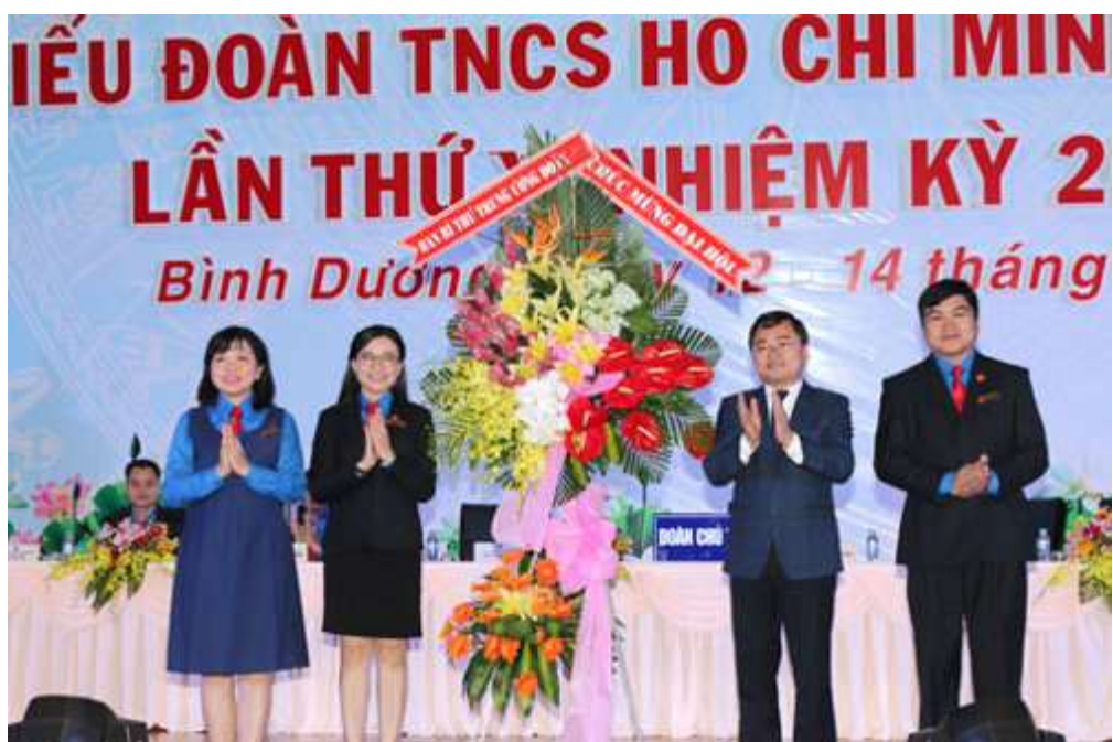
Đồng chí Nguyễn Anh Tuấn (thứ 2 từ phải sang) - Bí thư BCH Trung ương Đoàn tặng lẵng hoa chúc mừng Đại hội đại biểu Đoàn TNCS Hồ Chí Minh tỉnh Bình Dương lần thứ X, nhiệm kỳ 2017 - 2022

Bí thư BCH Trung ương Đoàn Nguyễn Anh Tuấn phát biểu tại Đại hội cũng đã biểu dương những kết quả mà Đoàn Thanh niên trong tỉnh Bình Dương đã đạt được trong nhiệm kỳ qua. Để phát huy những kết quả đã đạt được trong nhiệm kỳ tới, đồng chí Nguyễn Anh Tuấn mong muốn các cấp bộ Đoàn cần tiếp tục tập trung giáo dục đạo đức, lối sống cho đoàn viên thanh niên; phát triển tổ chức Đoàn - Hội - Đội ngày vững mạnh; thu hút, tập hợp thêm nhiều thanh niên công nhân ở các khu công nghiệp, khu đông dân cư tham gia các hoạt động do tổ chức Đoàn, Hội tổ chức; phát huy vai trò nòng cốt của đoàn viên trong các tổ chức chính trị - xã hội; nâng cao vai trò tổ chức Đội TNTP Hồ Chí Minh; chủ động nắm bắt tình hình tư tưởng thanh niên, tránh các biểu hiện suy thoái, lệch lạc về đạo đức, lối sống; chú trọng sử dụng các trang mạng xã hội trong công tác thông tin, tuyên truyền nhằm định hướng, giáo dục thanh niên; triển khai và thực hiện tốt 3 phong trào, 3 chương trình hành động cách mạng trong nhiệm kỳ mới...